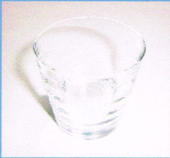
クリスタルグラス オールド 600円