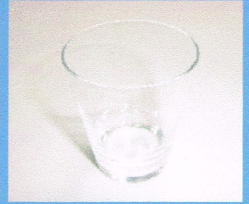
タンブラーグラス 200円 ※写真とは異なる 可能性があります